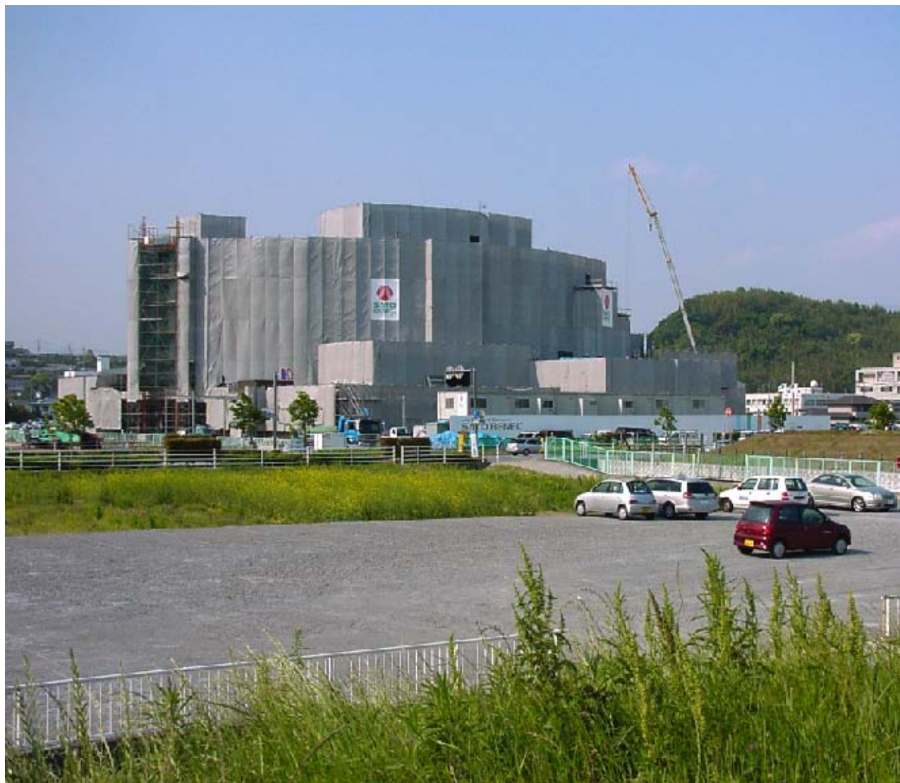
ななせ川から新病院を望む