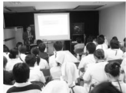
NST院内勉強会 定期的開催しています。