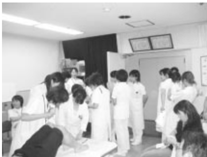
身体測定実習の様子。 栄養状態の把握ができます。

メンバーは褥瘡委員を中心に医師、看護師、栄養士、薬剤師、理学療法士、検査技師で構成されています。それぞれの専門性や知識を結集して栄養状態に問題がある患者様を改善するチームです。現在は対象患者の栄養評価、問題症例の抽出、プラン作成を行い、月数回の勉強会を院内で行っています。病気や栄養に関することで少しでも悩まれていることがありましたら、お気軽に医師、看護師、栄養士、薬剤師までお知らせください。