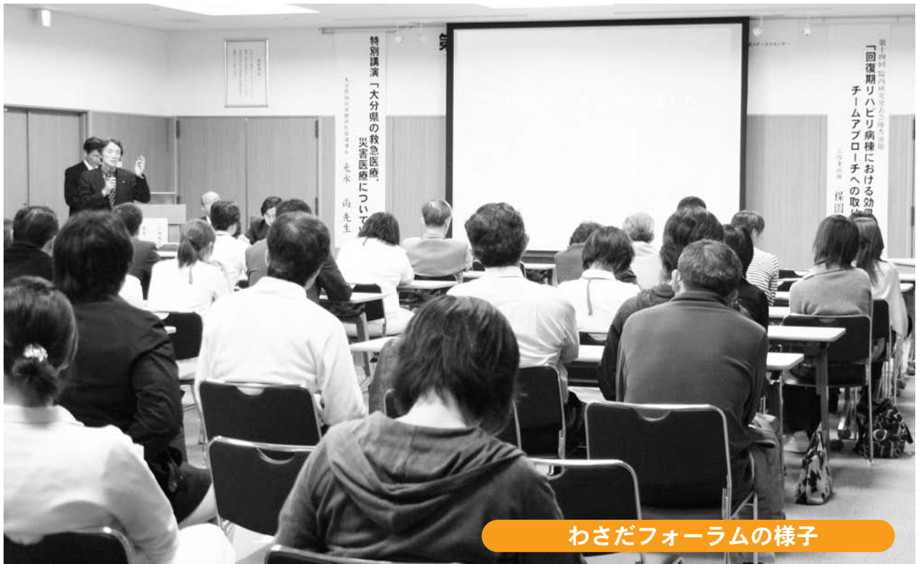
わさだフォーラムの様子