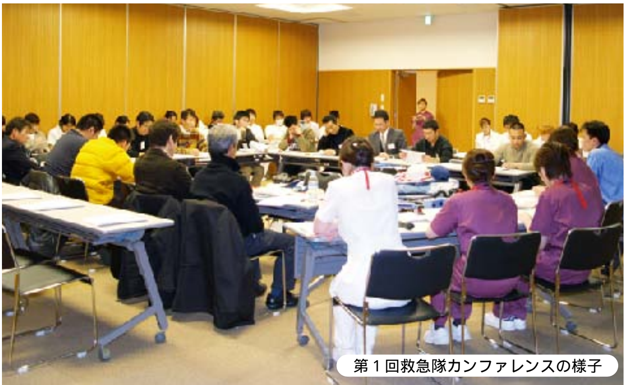
第1回救急隊カンファレンスの様子